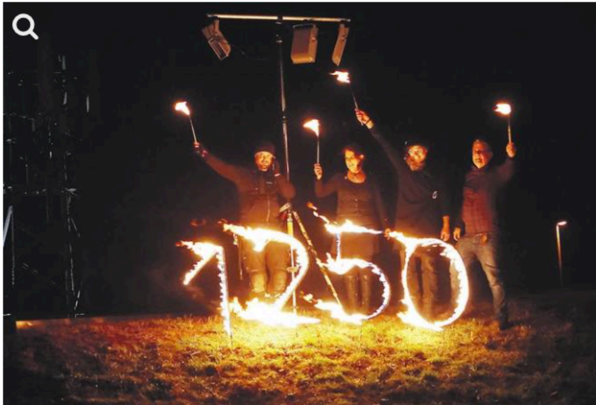
Die Richener und auch die Gemminger (Bild) entzündeten zum Auftakt einen Jubiläumsschriftzug.